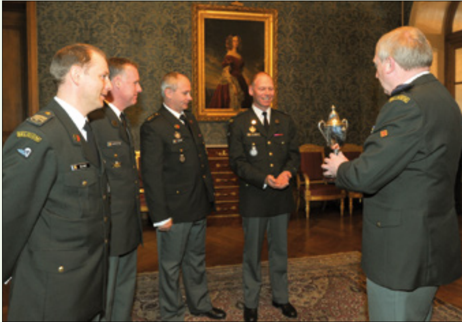
De Generaal overhandigt de Beker van de Koning aan de ploeg Gent