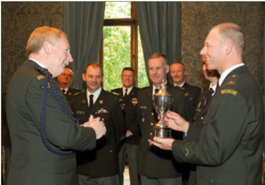
De ploeg Gent heeft de Beker van de Koning ontvangen