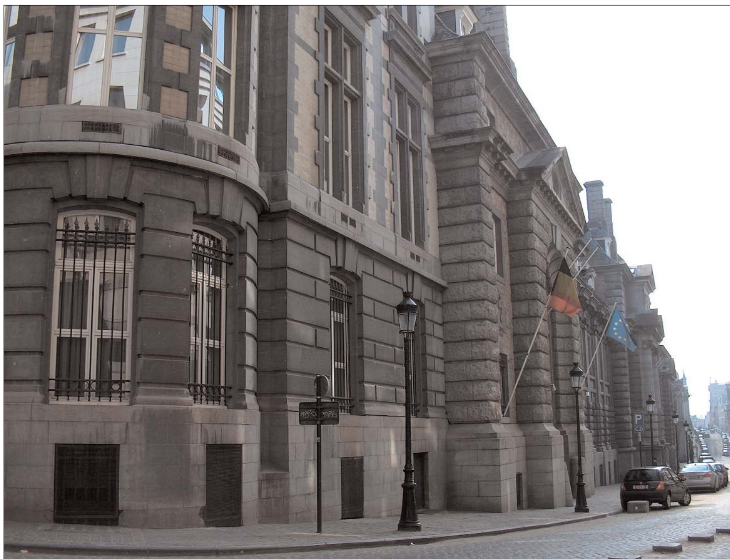
Le Quartier Prince Albert à Bruxelles

UNION ROYALE NATIONALE DES OFFICIERS DE RÉSERVE DE BELGIQUE a.s.b.l. KONINKLIJKE NATIONALE VERENIGING VAN DE RESERVEOFFICIEREN VAN BELGIË v.z.w.