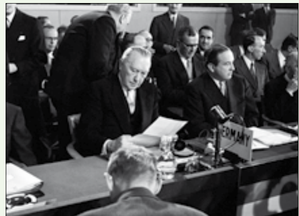
Paris, France 6 May 1955 Germany (Chancellor Konrad Adenauer) takes his seat at the Council table.

At home as well as abroad, their civic education programs aim at promoting freedom and liberty, peace, and justice. They focus on consolidating democracy, on the unification of Europe and the strengthening of transatlantic relations, as well as on development cooperation.